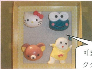
可愛らしいキャラクターの完成♪

小物作りで紙粘土を使って、マグネットを作りました。皆様、手でしっかりと形を整えて孫さんのために作っている方もいらっしゃいましたよ！！