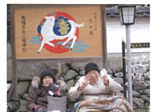
( 構成者：佐々木 猛 )