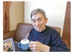
( 構成者：濱口 尚久 )