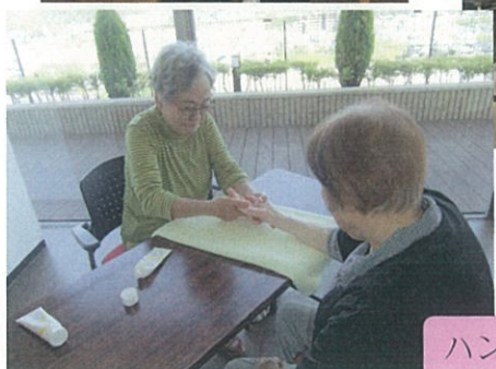
ハンドマッサージ