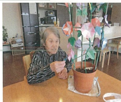
あさがお飾り作り