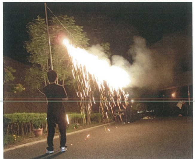
クローバーの丘花火大会