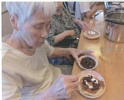
ホットケーキ作り