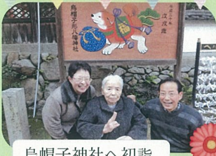
烏帽子神社へ初詣