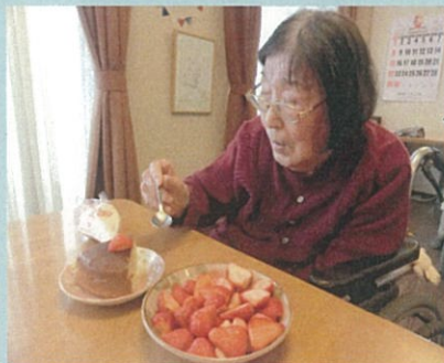
ホットケーキミックスを 使って炊飯器でケーキを 作りました♪♪ 果物やクリームを のせてできあがり