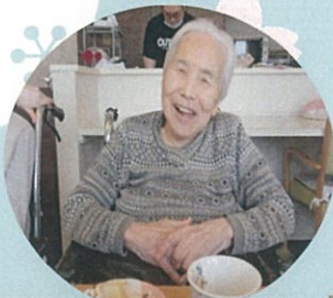
烏帽子公園に花見へ 行ってきました！ 気候もよく 絶好のお花見日和でした