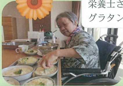
栄養士さんと グラタンを作りました