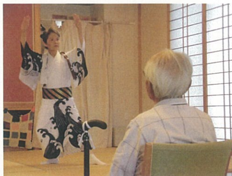
さくら会踊り鑑賞