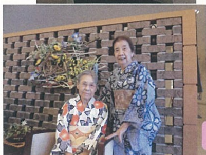
浴衣姿で写真撮影