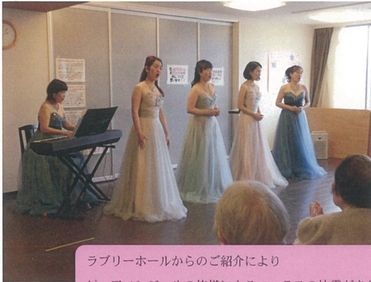
ラプリーホールからのご紹介により ピュアエンジェルの皆様によるコーラスの披露がありました。