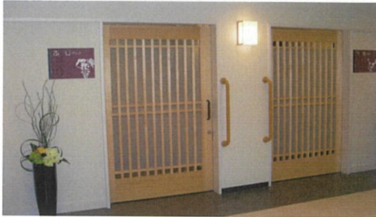
ユニット玄関外改善前

発行／（福）長野社会福祉事業財団 クローバーの丘 〒586-0035 河内長野市小塩町 431 番地 3 TEL 0721-60-1100 FAX 0721-60-1101