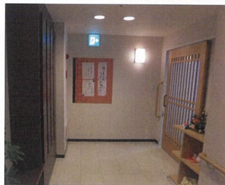
ユニット玄関内改善前

ユニットは1軒の家として、ここからが自分の住まいと区別できるように、暮らしの場としての設えを進めています。各ユニットともに住まいの玄関をご利用者様に感じてもらうことを目指しています。