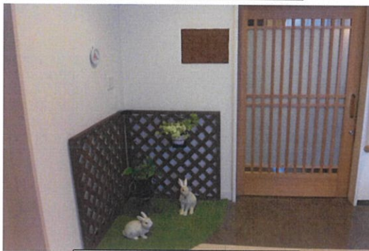
ユニット玄関外改善後

ユニットは1軒の家として、ここからが自分の住まいと区別できるように、暮らしの場としての設えを進めています。各ユニットともに住まいの玄関をご利用者様に感じてもらうことを目指しています。