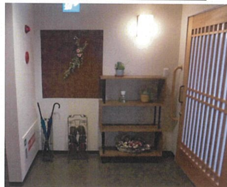
ユニット玄関外改善後